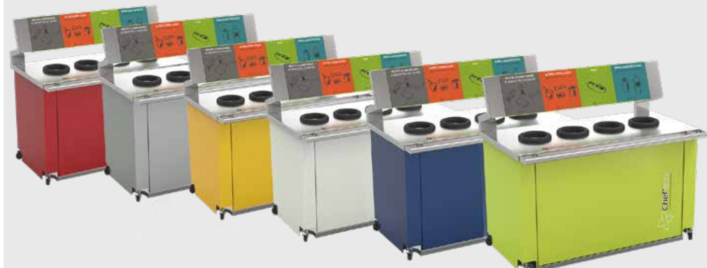
TABLE DE DÉBARRASSAGE VAISSELLE

Possibilité d'autres couleurs sur devis uniquement